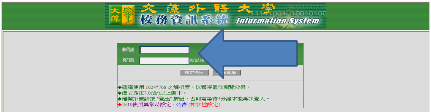
【圖四】請閱讀 點名說明 之後，直接「進入點名作業」